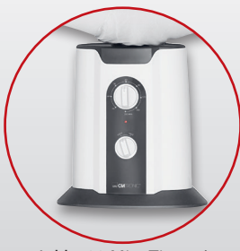
Inkl. 180 Min. Timer / 2 Temperaturstufen